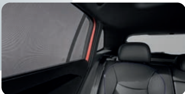
VW SONNENSCHUTZ FÜR TÜRSCHIEBEN HINTEN UND HECKSCHEIBE IN SCHWARZ

5-teiliges Set, Polyestergewebe, passgenau, auch bei geöffnetem Fenster nutzbar.