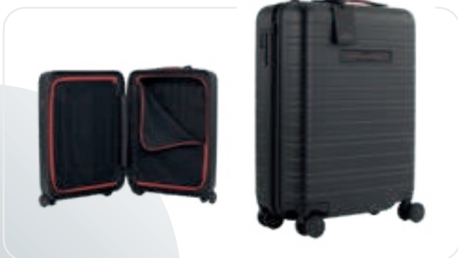
VW GTI KOFFER SCHWARZ/ROT GRÖSSE S (38x55x20 CM), GTI KOLLEKTION

Hartschale, bordfähig, 4 Rollen im Felgenmuster, TSA-Schloss, GTI-Wabenstruktur. Co-Branding Horizn Studios.